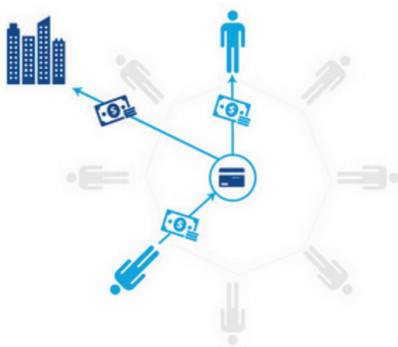
Base de données centralisée (cas classique)